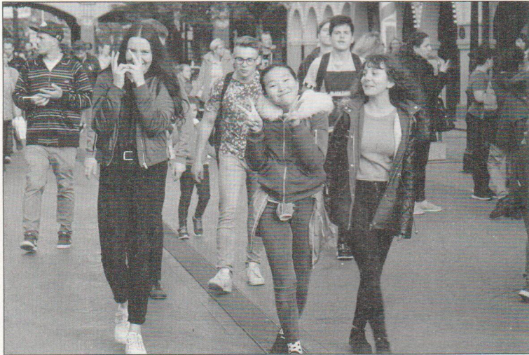
La bonne humeur reste de mise malgré l'approche de la sortie.

L'Europa-Park est l'endroit parfait pour perdre des enfants, mais cela n'a refroidi personne. Tous étaient ponctuels pour le pique-nique de 12h30 et tous étaient dans le car pour le dé-